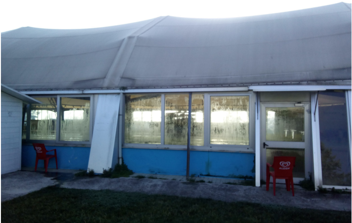
PISCINA vista esterna_ si notano il muretto in muratura e gli infissi con gravi problemi di condensa