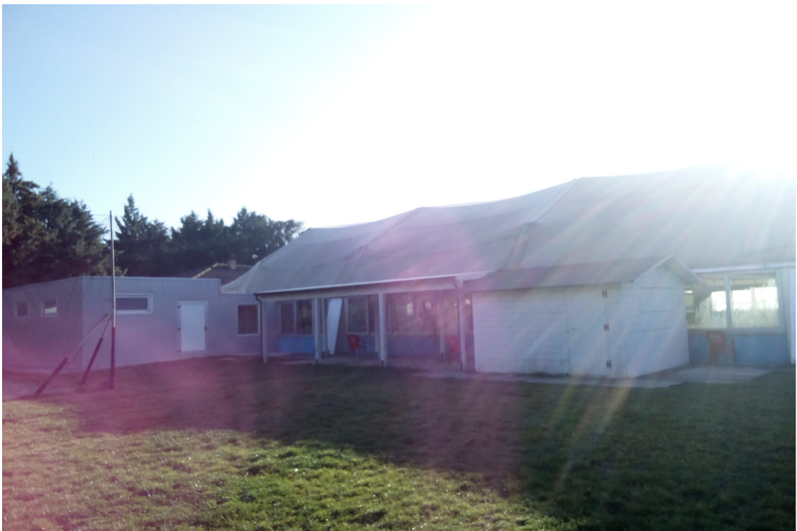
PISCINA vista esterna_ si nota la copertura in pvc