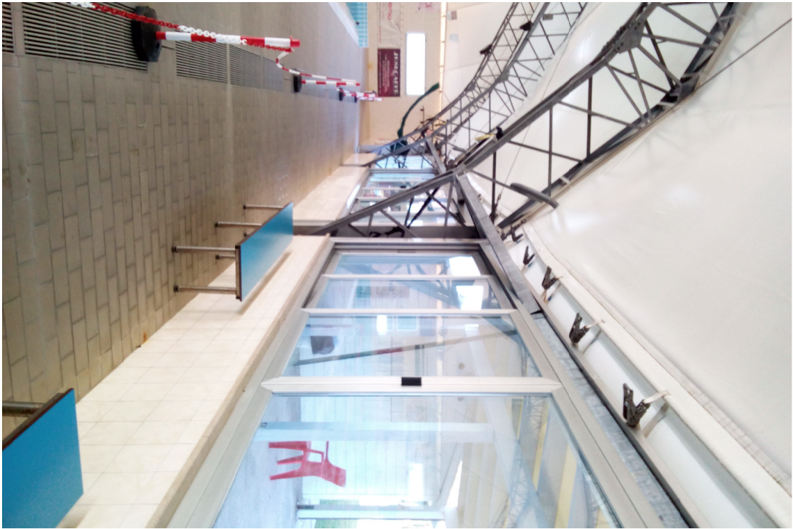
PSCINA vista interna