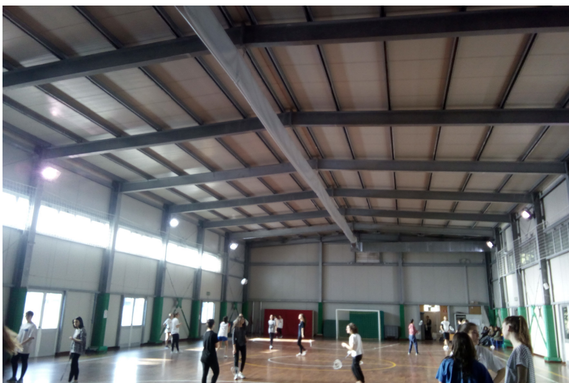
ZANNONI vista interna