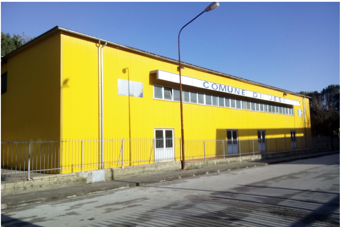
ZANNONI ripresa esterna delle due palestre