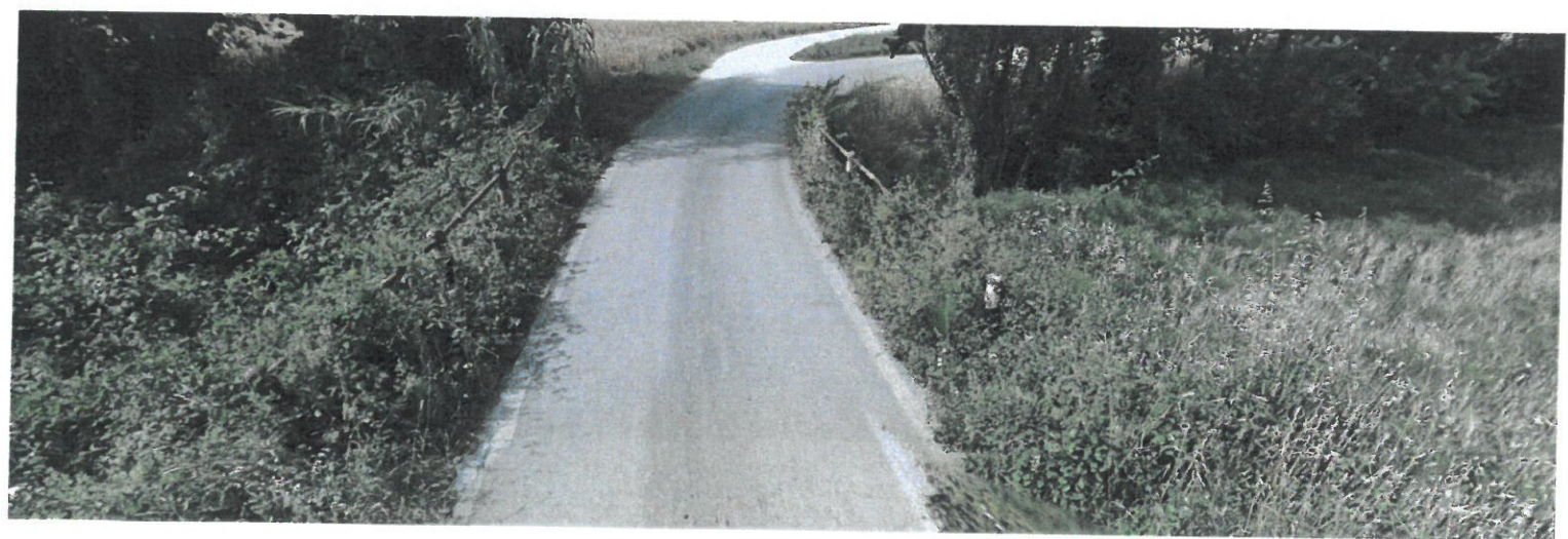
Intersezione via Tabano